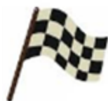
Drapeau à damier Fin de session ou du roulage. Ralentir après le drapeau à damier et rentrer directement au paddock.