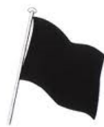
Drapeau noir Informe le pilote concerné que sa voiture a des ennuis mécaniques susceptibles de constituer un danger pour lui-même ou pour les autres pilotes et qu'il doit s'arrêter OBLIGATOIREMENT dans la voie des stands