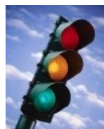
Feu rouge ou drapeau rouge Les voitures réduisent immédiatement leur vitesse et se dirigent lentement, sans doubler, vers la voie des stands