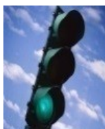
Feu vert Roulage normal