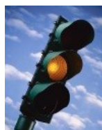
Feu jaune clignotant ou drapeau jaune Réduisez votre vitesse, ne doublez pas. Soyez prêt à changer de direction. Il y a un danger sur le bord ou sur une partie de la piste